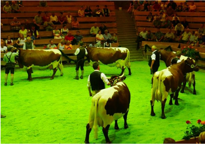
Die Pinzgauer-Kollektion im Ring